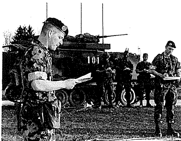
Das Panzersappeurbataillon 11 gehört zur Panzerbrigade 11 und zeigte erneut sein militärisches Wissen und Können.

Es war beeindruckend, wie gekonnt und präzise die Befehle umgesetzt wurden. Ein Transporthelikopter lenkte vorübergehend die Blicke gen Himmel, ehe Minenräumpanzer und andere schweren Geräte ihre Fähigkeiten demonstrierten.